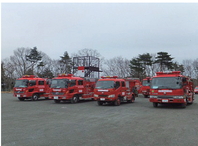
派遣隊員の乗車車両

札幌市消防局（6人） 仙台市消防局（21人） さいたま市消防局（9人） 千葉市消防局（6人） 東京消防庁（30人） 横浜市消防局（24人） 川崎市消防局（9人） 名古屋市消防局（9人） 京都市消防局（9人） 大阪市消防局（27人） 神戸市消防局（9人） 広島市消防局（6人） 松山市消防局（6人） 北九州市消防局（6人） 福岡市消防局（6人）