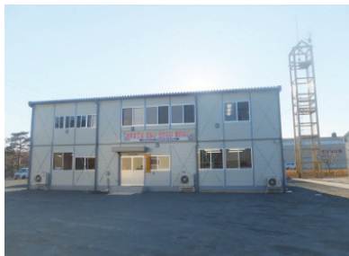
双葉消防本部仮設庁舎